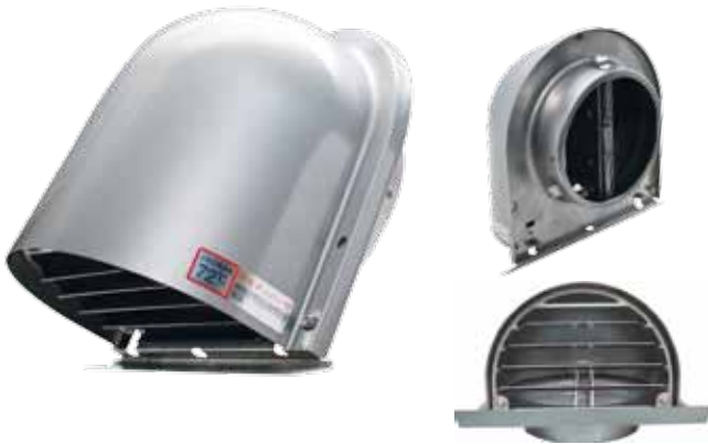
LH 100 UD