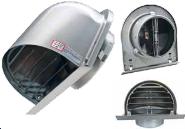
LH 100 SD