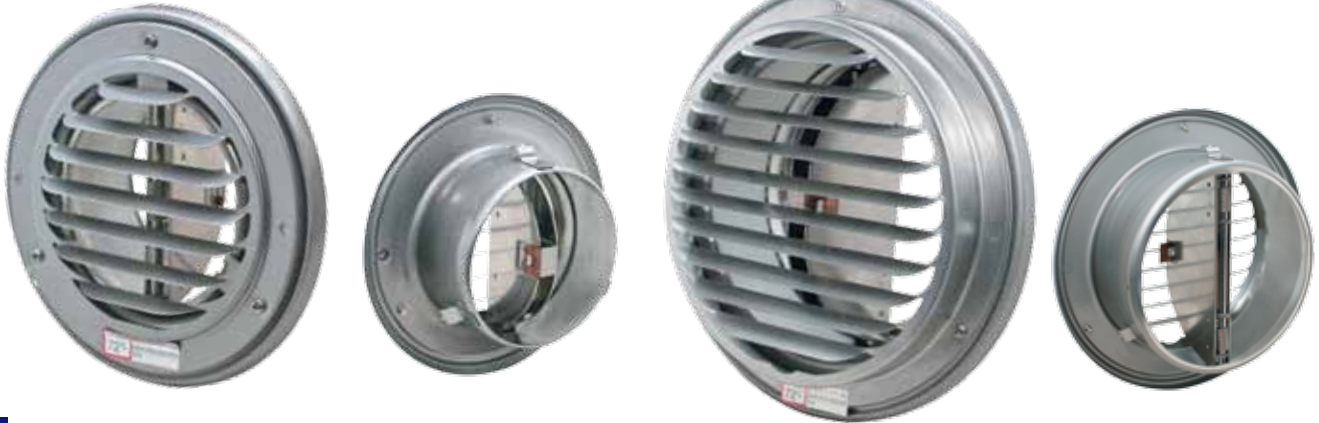
G 150 D